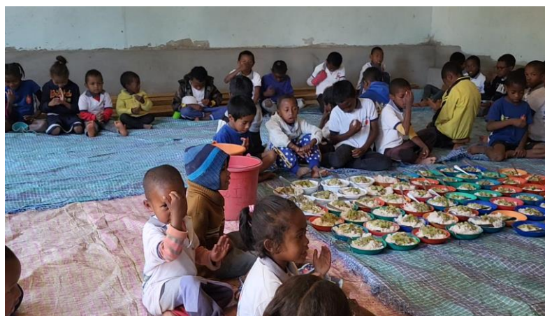
La cantine M. Thérèse Janneau de Fandrine avant l'équipement de tables.

AIDER a transmis 200 ordinateurs à 5 Lycées et formé les enseignants.