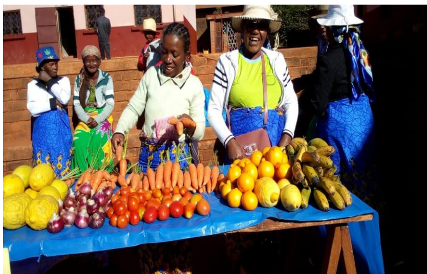
Les femmes jardinières exposent leur production de légumes.