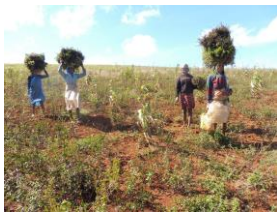
Portage des tagettes

Autres objectifs 2022 : production d'huiles essentielles 300 Kg de Ravintsara et 160 Kg de Géranium.