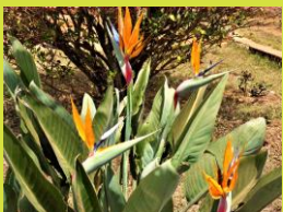
L'oiseau du Paradis