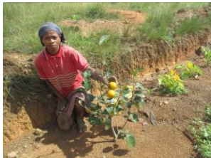
Récolte des fruits de kakis