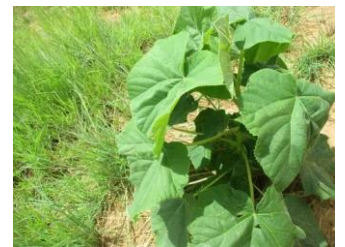
Plant de Paulownia en janvier.... le même en avril