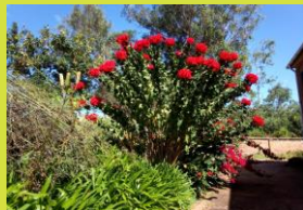
Madagascar ( c'est son nom )