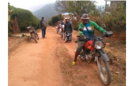
Villages isolés, déplacements, transports difficiles