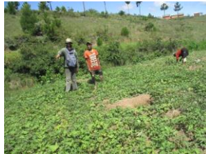
.. des beaux légumes