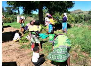
.. au point de collecte