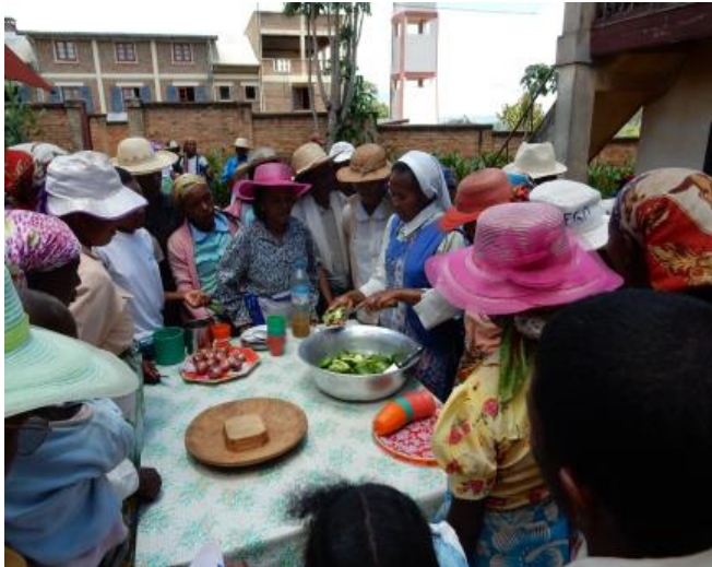
Formation «hygiène et nutrition» des jardinières